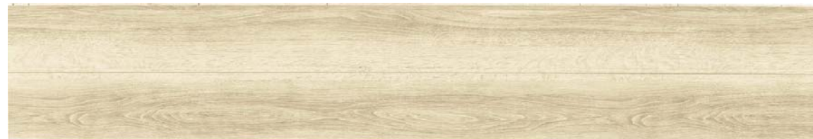
6F: チョークドオーク