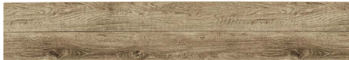
6G: ピンテージオーク