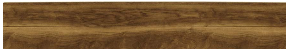
6J: グランドウォールナット