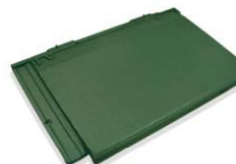
フォレストグリーン