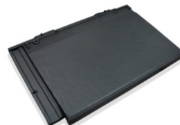
カナディアンブラック